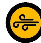
Belüftung der Vortragsräume