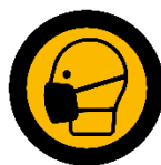
Wearing of face-to-face masks