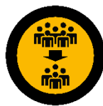
Platzreduzierung in Vortragsräumen