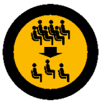
Reduzierung der Teilnehmerzahl

Wir haben ausserdem auf Basis aktueller Richtlinien ein Hygienekonzept entwickelt, in welchem wir Handlungsempfehlungen des RKI, des Berliner Senats, des visit.Berlin Convention Office, sowie des R.I.F.E.L Institutes berücksichtigt haben.