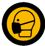
Tragen von Mund-Nasen-Bedeckung