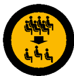
Reduced number of participants

We have also developed a hygiene concept based on current guidelines, in which we have taken into account recommendations for action from the RKI, the Berlin Senate, the visit.Berlin Convention Office and the R.I.F.E.L Institute.