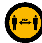
Compliance with minimum distances