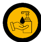
Additional hygiene stations