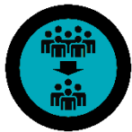
Reduced number of participants

We have also developed a hygiene concept based on current guidelines, in which we have taken into account recommendations for action from the RKI, the Berlin Senate, the visit.Berlin Convention Office and the R.I.F.E.L Institute.