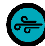
Belüftung der Vortragsräume