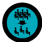
Platzreduzierung in Vortragsräumen