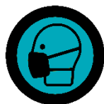
Wearing of face-to-face masks