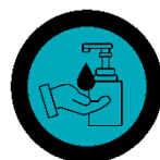
Additional hygiene stations